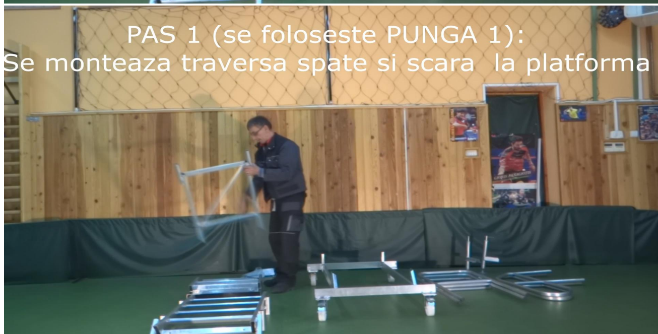
PAS 1 (se foloseste PUNGA 1): Se monteaza traversa spate si scara la platforma